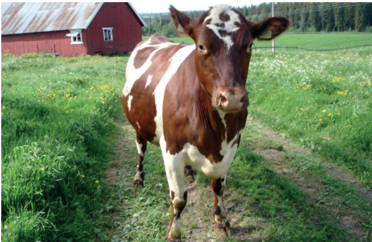
NRF kvige på sommerbeite